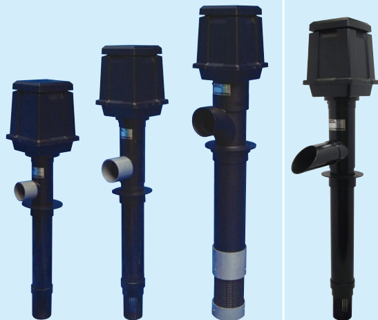
TP-50HR TP-100HR TP-140HR TP-30R 揚・循環ポンプ 循環のみ