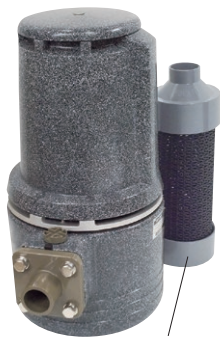
付属ストレーナー(40cm)