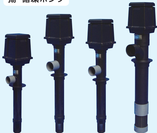
TP-50HR TP-70HR TP-100HR TP-140HR

※TP-140HRは50Hzか60Hzをご指定ください。 ※TP-100HR、TP-140HRは、 3相200Vも販売いたしております。